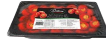
Poivrons farcis au thon 1kg REF : PF0034 DLC : 18 mois