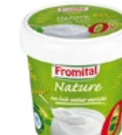
Raib nature sans sucre ajouté 900g REF : PF0014 DLC : 30 jours