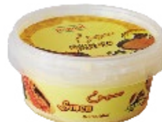
Smen 120g REF : PF0091 DLC : 1 an