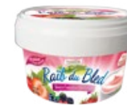
Raib aromatisé fraise 450g REF : PF0082 DLC : 30 jours