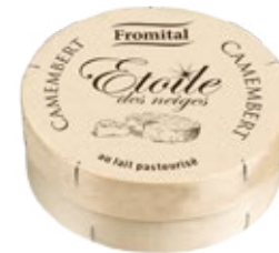
Étoile des neiges 250g