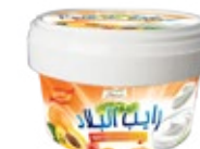
Raib aromatisé abricot 450g REF : PF0084 DLC : 30 jours