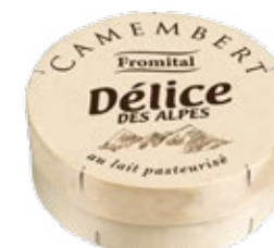
Délices des Alpes 250g