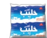
Lait Agadir 0,5L REF : PF0101 DLC : 3 jours