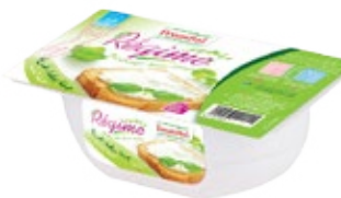
Fromage frais Allégé 180g