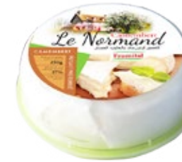
Le Normand 250g