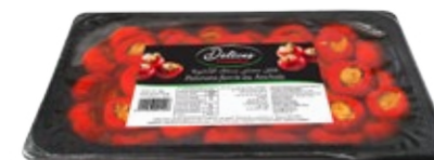
Poivrons farcis au anchois 1kg REF : PF0034 DLC : 18 mois