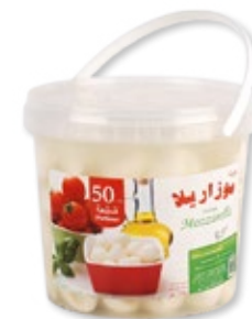
Mozzarelle cerise 1kg