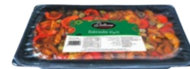
Taktouka 1kg REF : PF0034 DLC : 18 mois