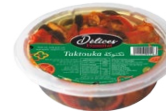
Taktouka 200g REF : PF0034 DLC : 18 mois