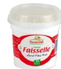
Fromage Faisselle 125g