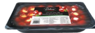
Poivrons farcis au fromage 1kg REF : PF0034 DLC : 18 mois