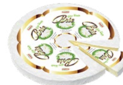
Brie meule 1kg