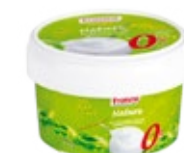
Raib nature sans sucre ajouté 450g REF : PF0107 DLC : 30 jours