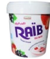
Raib brassé Fraise & fruit des bois 900g REF : PF0083 DLC : 30 jours