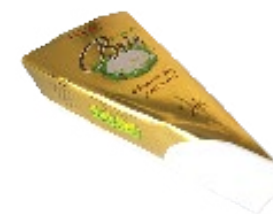
Pointe de brie 200g