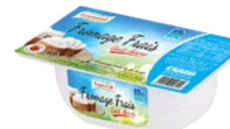
Fromage frais goût chèvre 250g