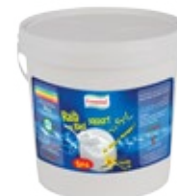
Raib aromatisé vanille 5kg REF : PF0141 DLC : 30 jours