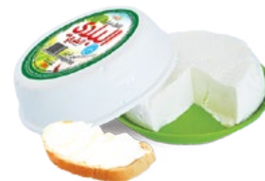
Fromage frais Beldi 250g