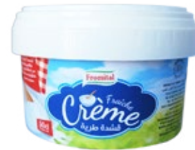
crème fraîche 50 cl REF : PF0094 DLC : 28 jours