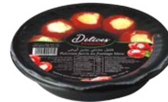
Poivrons farcis au fromage 130g REF : PF0034 DLC : 18 mois