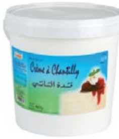
Crème à chantilly 5kg REF : PF0097 DLC : 30 jours