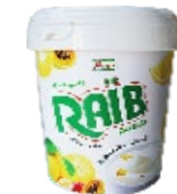
Raib brassé Citron & fruit tropicaux 900g REF : PF0085 DLC : 30 jours