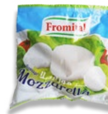
Mozzarelle boule 130g