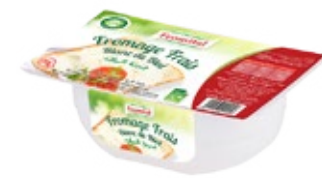
Fromage frais Blanc du bled 250g