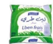
Lben 0,5L REF : PF0110 DLC : 21 jours