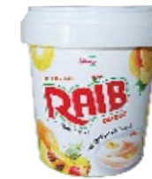
Raib brassé Abricot & fruit tropicaux 900g REF : PF0085 DLC : 30 jours