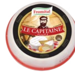
Le Capitaine 250g