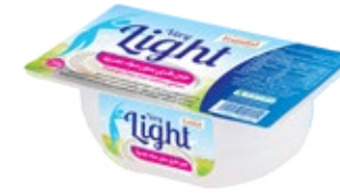
Fromage frais Light Sans matière grasse 250g