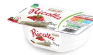
Fromage Ricotta 250g