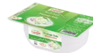
Fromage frais Ail & fines herbes 180g