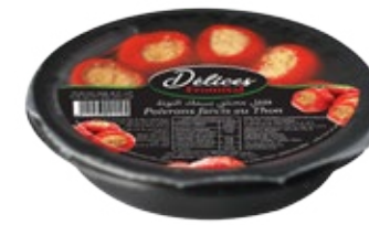
Poivrons farcis au thon 130g REF : PF0034 DLC : 18 mois