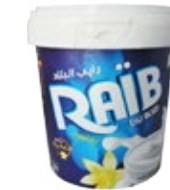
Raib aromatisé vanille 900g REF : PF0108 DLC : 30 jours