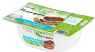
Mascarpone 250g REF : PF0098 DLC : 28 jours