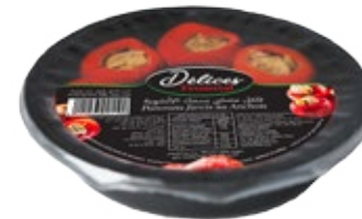
Poivrons farcis au anchois 130g REF : PF0034 DLC : 18 mois