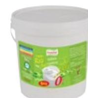
Raib nature sans sucre ajouté 5kg REF : PF0109 DLC : 30 jours