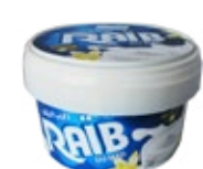
Raib aromatisé vanille 450g REF : PF0008 DLC : 30 jours