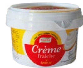
crème fraîche épaisse 20 cl REF : PF0096 DLC : 28 jours