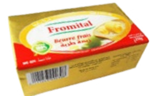
Beurre 250g REF : PF0088 DLC : 6 mois