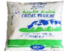
Crème fraîche sachet 50 cl REF : PF0128 DLC : 20 jours