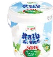
Raib sans : sucre, matière grasse, edulcorant 900g REF : PF0123 DLC : 30 jours