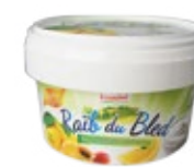
Raib aromatisé citron 450g REF : PF0084 DLC : 30 jours